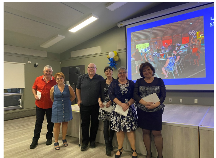
L'équipe de la cuisine gourmande

Un énorme merci à nos partenaires pour leur participation à la réalisation de cette belle soirée.